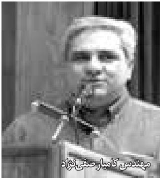
مهندسین کامیاب و صنی نژاد